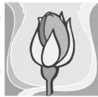
8. September: Mariä Geburt

So, 10.09.2017 Drolshagen: Blasmusikfestival St. Clemens. NUR 9 Uhr (keine hl. Messen um 8.45 und 10.15 Uhr) Ab 10 Uhr Blasmusikfest