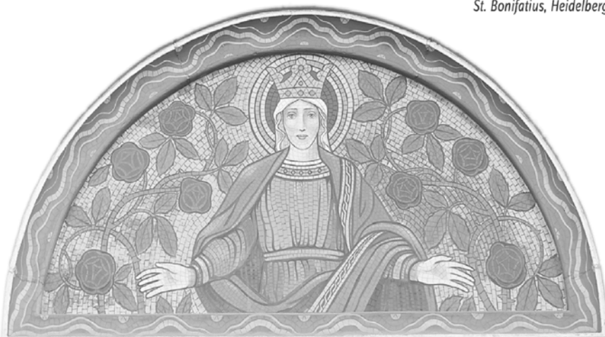
St. Bonifatius, Heidelberg

Im Mai feiert die Kirche die Gottesmutter Maria als Maienkönigin. Mitten im Frühling symbolisiert sie das blühende Leben, da sie Jesus das Leben geschenkt hat, durch den Gottes gute Schöpfung von der Vergänglichkeit des Todes erlöst wurde.